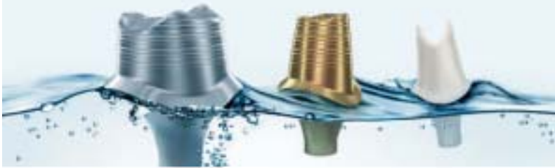
Atlantis™ Abutments in den Materialien – von links Titan, titannitridbeschichtetes Titan (goldfarben) und Zirkondioxid.

Der Implantathersteller bietet eine langjährige Garantie für Atlantis™ Abutments, die auch das verwendete Implantat einschließt. Diese Garantieleistung stellt einen zuverlässigen Ser-