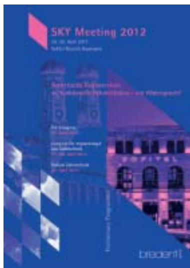
Das „Preliminary Programme“ zum SKY Meeting 2012.

Wer von seinen Patienten als kompetenter Berater und fortschrittlicher Behandler wahrgenommen werden möchte, der kann beim SKY Meeting 2012 das notwendige Rüstzeug dafür erwerben. Der Kongress für Implantologie und Zahntechnik samt Pre-Congress findet vom 26. April bis zum 28. April 2012 unter dem Motto „Ästhetische Regeneration vs. funktionelle Rehabilitation – ein Widerspruch?“ statt