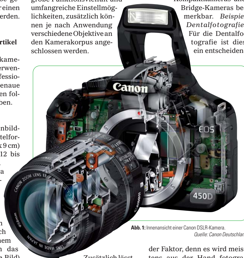
Abb. 1: Innenansicht einer Canon DSLR-Kamera.

ten Flächen) umlenkt, der für den Sucher ein seitenrichtiges und aufrecht stehendes Bild erzeugt. Durch diese Technik ist das Bild im Sucher identisch mit dem Bild auf dem Bildsensor. Erst beim Auslösen wird der Schwenkspiegel hochgeklappt und die Lichtstrahlen können dann auf den Bildsensor fallen. Spiegelreflexkameras besitzen eine große Funktionsvielfalt und umfangreiche Einstellmöglichkeiten, zusätzlich können je nach Anwendung verschiedene Objektive an den Kamerakorpus angeschlossen werden.