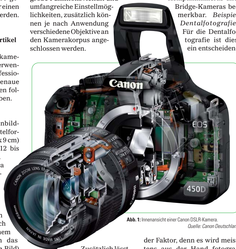
Abb. 1: Innenansicht einer Canon DSLR-Kamera.

ten Flächen) umlenkt, der für den Sucher ein seitenrichtiges und aufrecht stehendes Bild erzeugt. Durch diese Technik ist das Bild im Sucher identisch mit dem Bild auf dem Bildsensor. Erst beim Auslösen wird der Schwenkspiegel hochgeklappt und die Lichtstrahlen können dann auf den Bildsensor fallen. Spiegelreflexkameras besitzen eine große Funktionsvielfalt und umfangreiche Einstellmöglichkeiten, zusätzlich können je nach Anwendung verschiedene Objektive an den Kamerakorpus angeschlossen werden.