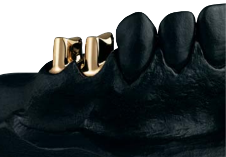
ORPLID® TK – Zahntechnische Arbeit.

schaften der Legierung wurden um ein Mehrfaches verbessert. Kratzer, Klemmen und Verankern von abnehmbaren Arbeiten gehören mit ORPLID® TK der Vergangenheit an.