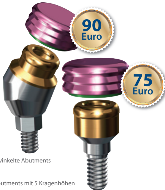
15° & 30° abgewinkelte Abutments