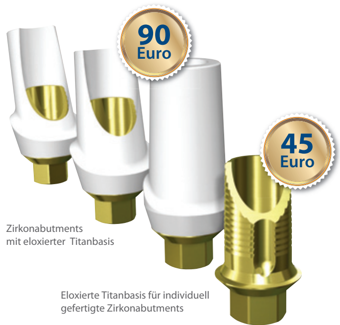
Zirkonabutments mit eloxierter Titanbasis