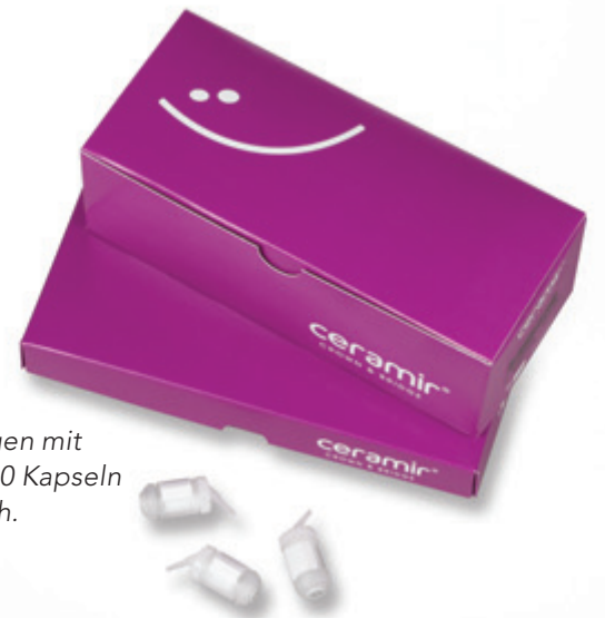
Packungen mit 5 oder 20 Kapseln erhältlich.

Durch Verwendung der revolutionären neuen patentierten* biokeramischen Nano-Technologie, bietet Ceramir® Crown & Bridge überlegene Biokompatibilität und zahnphysikalische Eigenschaften, die Mikro-Leckage zu hemmen, Optimierung der Langzeitstabilität und eine ausgezeichnete Retention für den langfristigen Erfolg. Ceramir® Crown & Bridge – die neue Dimension des Zementierens. Bestellen Sie noch heute bei Ihrem Henry Schein Dental Depot.