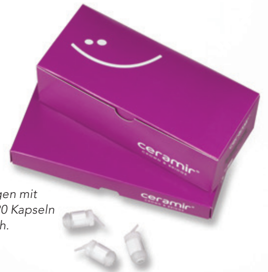
Packungen mit 5 oder 20 Kapseln erhältlich.

Durch Verwendung der revolutionären neuen patentierten* biokeramischen Nano-Technologie, bietet Ceramir® Crown & Bridge überlegene Biokompatibilität und zahnphysikalische Eigenschaften, die Mikro-Leckage zu hemmen, Optimierung der Langzeitstabilität und eine ausgezeichnete Retention für den langfristigen Erfolg. Ceramir® Crown & Bridge – die neue Dimension des Zementierens. Bestellen Sie noch heute bei Ihrem Henry Schein Dental Depot.