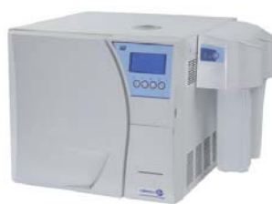
mit Mocopure 100