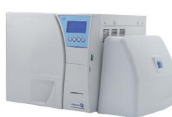
mit Mocopure 500