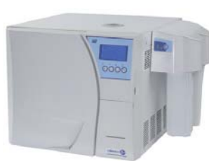
mit Mocopure 100