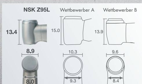
Die weltweit kompaktesten Abmessungen