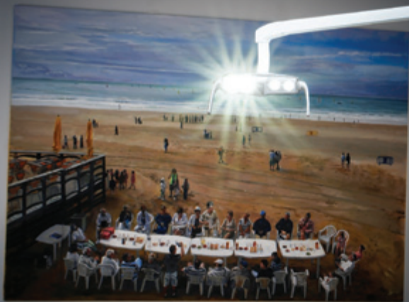
ISee Nordlicht Leuchte + LED OP-Lampe