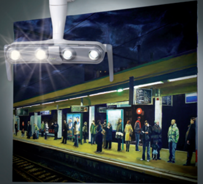
LED OP-Lampe lolo

Euvres de Marc Goldstein - Photographie - © 2010 - 9/2001 Wry-sur-Seine