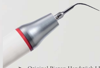
> Original Piezon Handstück LED mit EMS Swiss Instrument PS

Praktisch keine Schmerzen für den Patienten und maximale Schonung des oralen Epitheliums – grösster Patientenkomfort ist das überzeugende Plus der Original Methode Piezon, neuester Stand. Zudem punktet sie mit einzigartig glatten Zahnoberflächen. Alles zusammen ist das Ergebnis von linearen, parallel zum Zahn verlaufenden Schwingungen der Original EMS Swiss Instruments in harmonischer Abstimmung mit dem neuen Original Piezon Handstück LED.