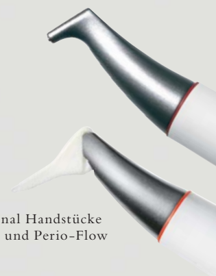
> Original Handstücke Air-Flow und Perio-Flow

Und wenn es um das klassische supra- gingivale Air-Polishing geht,