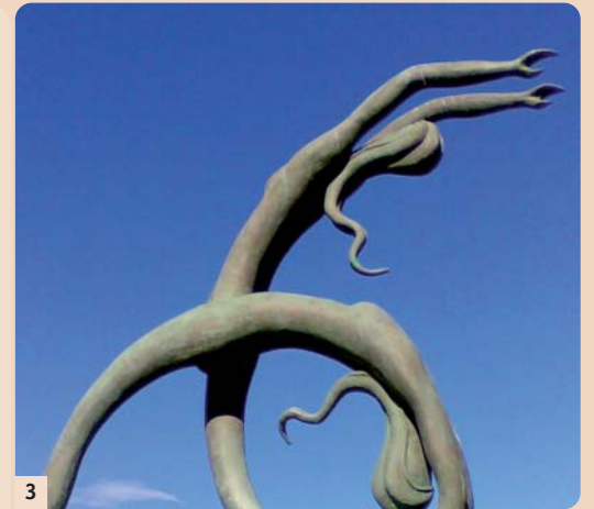
Das weibliche Schlankheitsideal künstlerisch dargestellt. (Skulptur: Hafenpromenade in Heraklion, Kreta. Foto: Prof. Dr. Peter Keel)