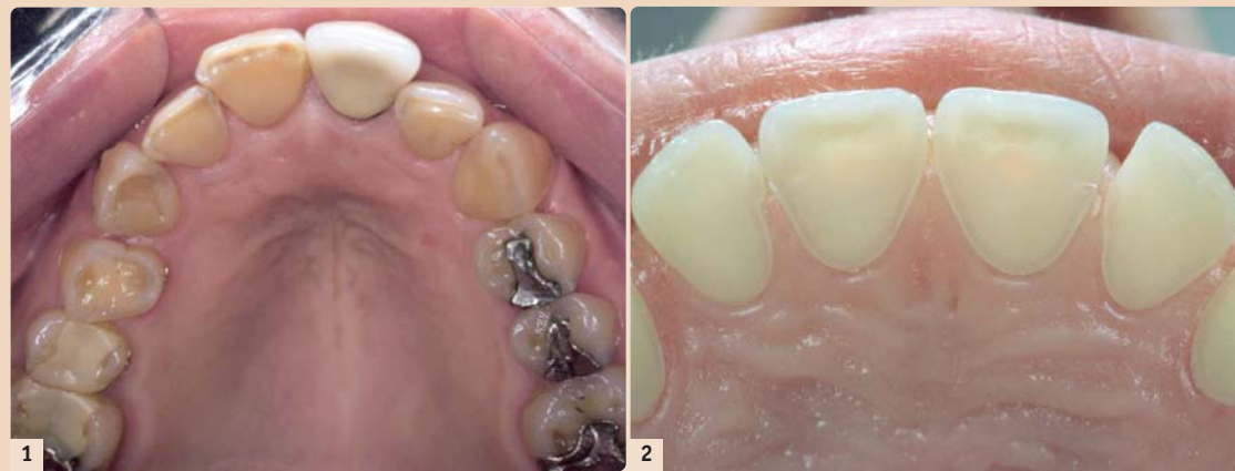
Abb. 1: Oberkiefer eines 29-jährigen Mannes (!) mit einer jahrelangen Essstörung. – Abb. 2: Das Bild zeigt eine ca. 25-jährige Frau mit massiven Substanzverlusten an den Palatinalflächen am Oberkiefer, sodass bereits die Pulpa rosa durchscheint.

Das Leiden beginnt bei Frauen (selten auch bei Männern) meist in den Pubertätsjahren (mittleres Al-