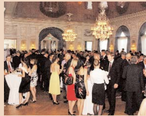
Aperéro im Salon du Palais.

Nach der Diplomübergabe begaben sich Absolventen und Gäste in die Jugendstil-Hotelhalle und den Salon du Palais für den Apéro. Die stolzen Eltern und ihre erfolgreichen