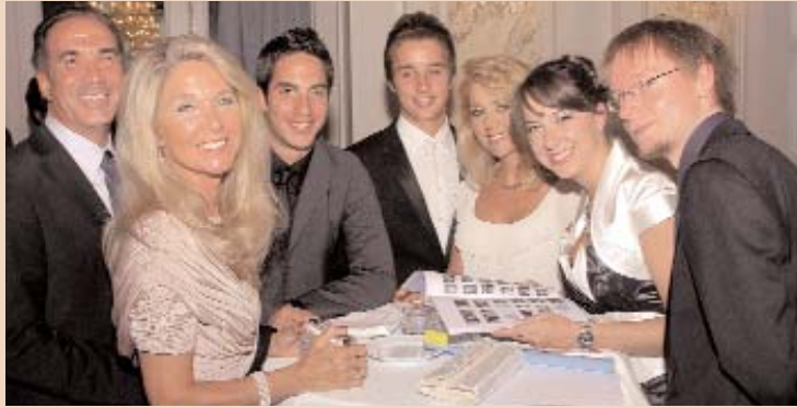
Bereits jetzt sehr beliebte Jubiläumsschrift „90 Jahre ZMK Bern – 60 Jahre VEB“.