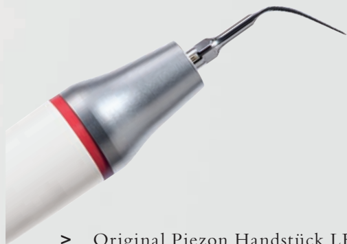
> Original Piezon Handstück LED mit EMS Swiss Instrument PS

Praktisch keine Schmerzen für den Patienten und maximale Schonung des oralen Epitheliums – grösster Patientenkomfort ist das überzeugende Plus der Original Methode Piezon, neuester Stand. Zudem punktet sie mit einzigartig glatten Zahnoberflächen. Alles zusammen ist das Ergebnis von linearen, parallel zum Zahn verlaufenden Schwingungen der Original EMS Swiss Instruments in harmonischer Abstimmung mit dem neuen Original Piezon Handstück LED.