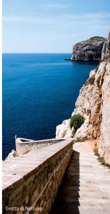
Grotta di Nettuno

Diese prähistorischen Bauten, von der es auf Sardinien rund 7.000 gibt, hatten ihre Verwendung als Wehrtürme, Tempel und Grabbauten. Zu den bekanntesten Nuraghen im Norden gehören Albucciu, Malchittu sowie die Gigantengräber Coddu Vecchiu und Li Lolghi, die allerdings vor Ort gar nicht so gigantisch sind, wie es der Name versprechen mag. Dennoch sind die archäologischen Funde einen Ausflug wert. Unser letztes Ziel in dieser Region war die Stadt Posadas, die malerisch auf einem Berg gelegen ist. Die Burgruine „Castello della Fava“, das Wahrzeichen Posadas auf der Spitze dieses Berges, ist schon von Weitem zu sehen. Ein Aufstieg lohnt sich, denn von hier oben wird man mit einem fantastischen Ausblick belohnt.