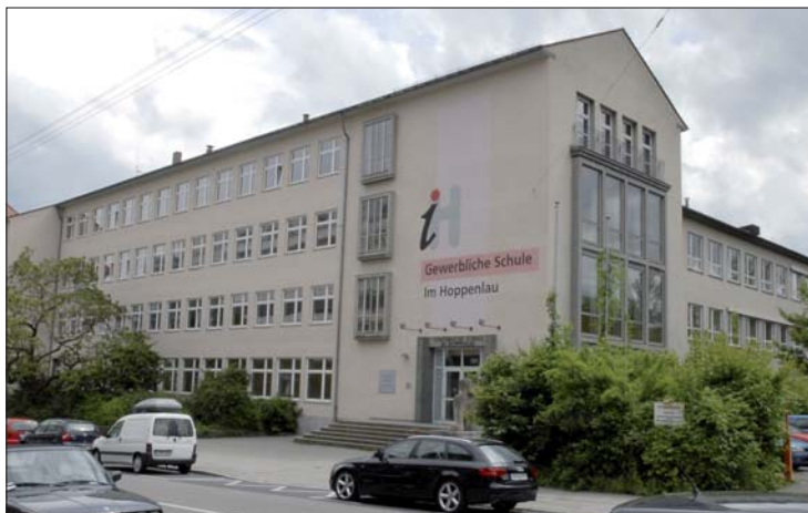
Gewerbliche Schule „Im Hoppenlau“, Meisterschule für Zahntechniker in Stuttgart.

Die Gewerbliche Schule „Im Hoppenlau“ in Stuttgart veranstaltet am 18. November 2011 einen Infonachmittag.