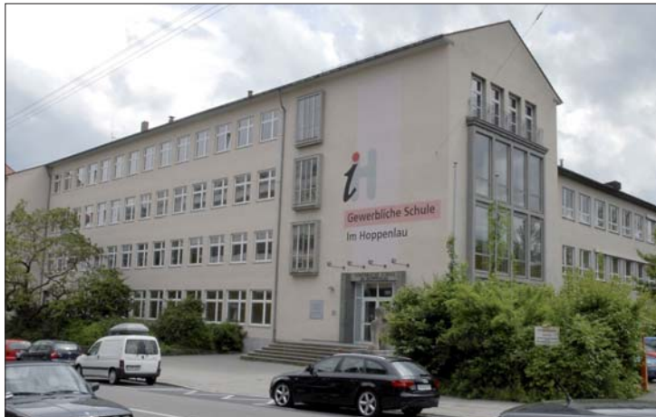
Gewerbliche Schule „Im Hoppenlau“, Meisterschule für Zahntechniker in Stuttgart.

Die Gewerbliche Schule „Im Hoppenlau“ in Stuttgart veranstaltet am 18. November 2011 einen Infonachmittag.