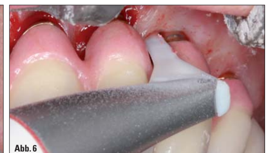
Abb. 3: Die Pulverstrahldüse sollte in einem Abstand von ca. 5–10 mm zur Biofilm/Zahnstein belasteten Oberfläche geführt werden. Die Absaugung des kontaminierten Strahlguts sollte möglichst nahe der Pulverstrahldüse entgegen der Strahlrichtung erfolgen. – Abb. 4: Unmittelbar nach der Pulverstrahl-Reinigung waren nur geringe Blutungen im Bereich der Zahnfleischielulki sichtbar. Nach einer antiseptischen Mundspülung (beispielsweise mit einer Chlorhexidinlösung) ist die Behandlung der periimplantären Mukositis beendet. – Abb. 5: Für die minimalinvasive, geschlossene Periimplantitisbehandlung wurde eine speziell auf die Taschenmorphologie optimierte Instrumentenspitze für die effektive Pulverstrahlanwendung in der Tiefe der Tasche eingesetzt (Perio-Flow, EMS). – Abb. 6: Die Pulverstrahlanwendung innerhalb der Zahnfleischtasche sollte höchstens fünf Sekunden lang andauern. Aufgrund des geringen Austrittsdrucks wird die Behandlung in der Regel nicht als schmerzhaft empfunden.