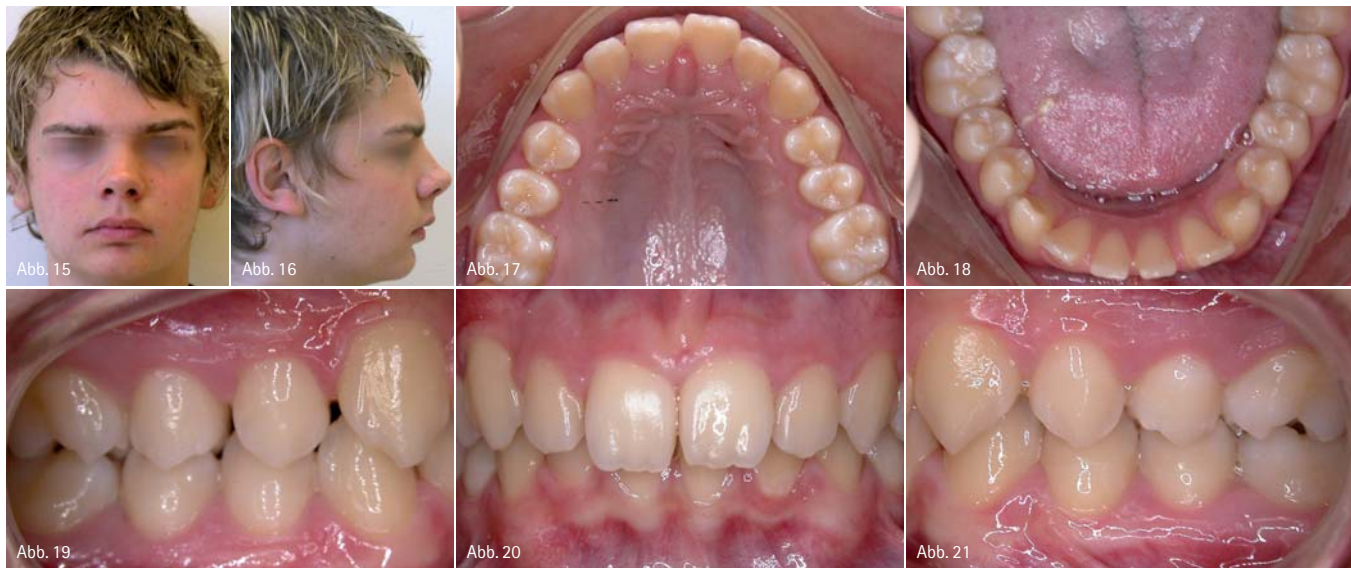
Abb. 15–21: Anfangsbefund, Distalbilslage.

in eine Klasse I-Relation zu ermöglichen, sollten zunächst die Fronten aufgerichtet werden. Hierfür wurde im Oberkiefer eine selbstligierende Lingualapparatur (In-Ovation® L) mit der gegossenen Schiene verbunden. Die Unterkieferfront wurde mit dem In-Ovation® R-System von labial beklebt,