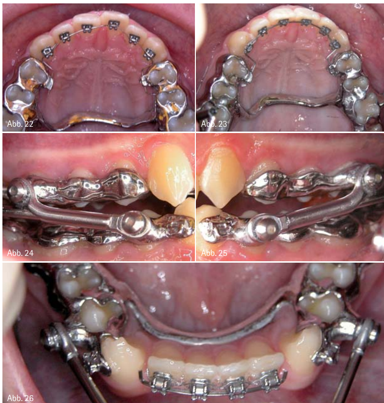
Abb. 22, 23: Ausformung der Oberkieferfront mit In-Ovation L-Brackets und Verankerung über die gegossene Herbst-Schiene. – Abb. 24, 25: Eingegliederte Herbst-Schnariere. – Abb. 26: Ausgeformte UK-Front.