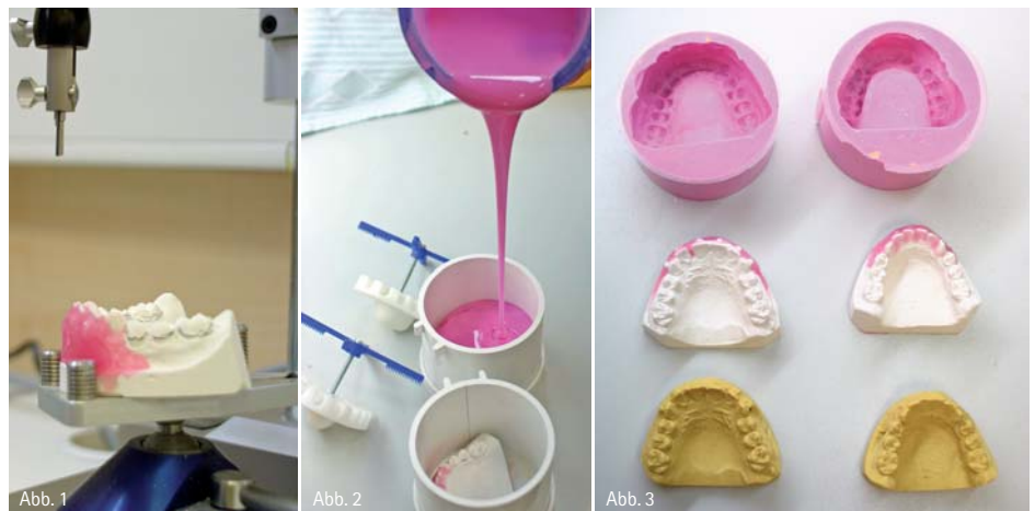
Abb. 1: Anzeichnen des prothetischen Äquators (Modellgussverfahren). – Abb. 2: Herstellung der Dublierform aus Silikon. – Abb. 3: Silikonform, Anfangsmodelle, Einbettmassemmodelle (gelb).

Der Erfinder Dr. Emil Herbst veröffentlichte erstmals anlässlich des Berliner Zahnärztekongresses 1909 seine Idee, eine Klasse II-Distalbissslage mit einer feststehenden Apparatur zu korrigieren. Das Ziel war es, den Unterkiefer dauerhaft und kompromisslos in einer stabilen Vorschublage (einer therapeutischen Position) zu halten und gleichzeitig das Gesichtprofil zu harmonisieren. Nach 1934 geriet diese Methode in Vergessenheit und wurde erst seit 1977 von Prof. Hans Pancherz wieder aufgegriffen und klinisch-experimentell untersucht. Pancherz zeigte, dass mit dem Herbst-Scharnier eine Stimulierung des Unterkieferwachstums möglich ist. Die Apparatur weist eine kombiniert dentoalveoläre und skelettale Wirkungsweise auf und führt zuverlässig zu einer Normalisierung der Okklusion. Durch die heutigen Herstellungstechniken hat man die anfängliche Reparaturanfälligkeit, die immer auch mit großem finanziellem und technischem Aufwand geschieht, sicher im Griff. Dadurch ist diese Apparatur wieder etabliert und aus der modernen kieferorthopädischen Praxis nicht mehr wegzudenken. Das Herbst-Scharnier gleicht einem künstlichen Gelenk, das Ober- und Unterkiefer miteinander verbindet. Doppelseitige Teleskope, die aus ei-