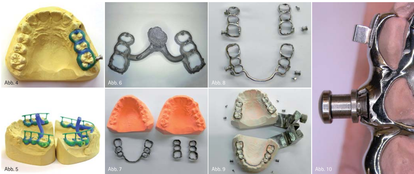
Abb. 4: Wachmodellation mit Gewinde Regio 26. – Abb. 5: Fertige Wachmodellation in beiden Kiefern, angestiftet. – Abb. 6: Oberkieferguss, abgestrahlt. – Abb. 7: Aufgepasster Modellguss OK/UK. – Abb. 8: Fertig hochglanzpolierter Modellguss OK/UK. – Abb. 9: Kontrolle der Position von Gewinde und Tubes im Fixator. – Abb. 10: Eingepasstes konfektioniertes Gewinde vor dem Lasern.

lungszeit von sechs bis neun Monaten erreicht werden. Behandlungsindikationen sind skelettale Klasse II-Dysgnathien mit Rücklage des Unterkiefers. Der ideale Zeitpunkt zur Eingliederung des Herbst-Scharniers ist erreicht, wenn der Zahnwechsel in den Stütz zonen abgeschlossen und das pubertäre Wachstumsmaximum erreicht oder sogar überschritten ist. Neben dem klassischen Behandlungsspektrum der herausnehmbaren FKO-Geräte können bei der Therapie mit der Herbst-Apparatur