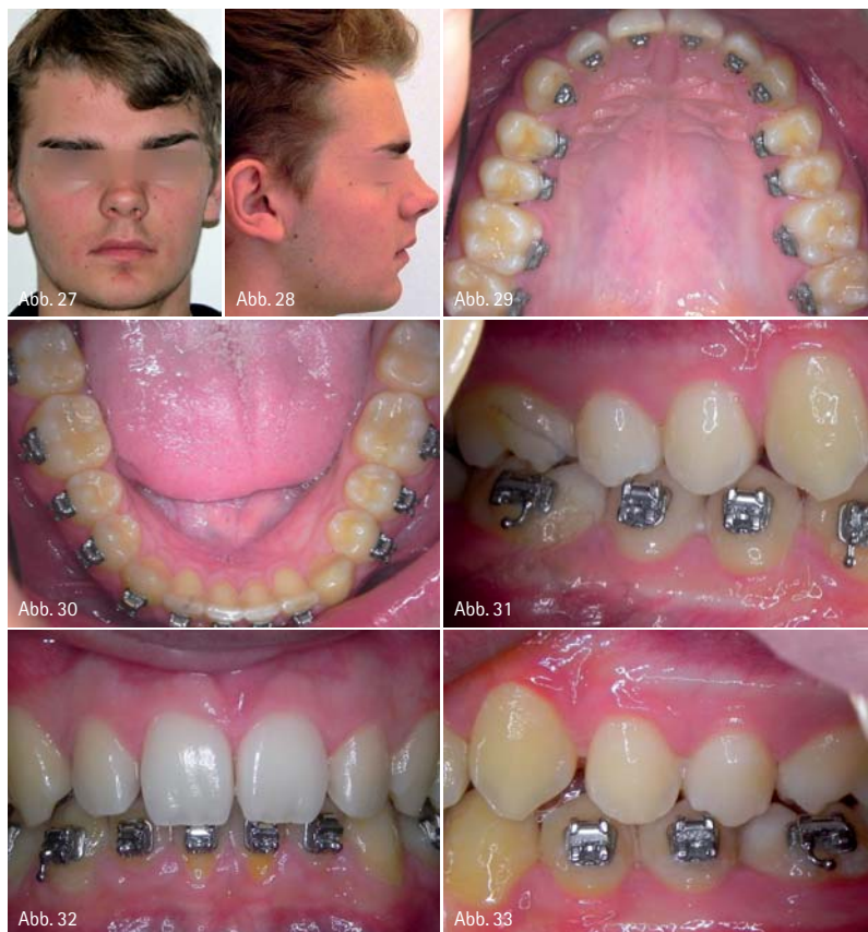
Abb. 27-28: Extraoraler Zustand nach Entfernung der Herbst-Schamniere. – Abb. 29-33: Aktueller intraoraler Zustand, Neutralokklusion.

den Kopf so weit wie möglich nach hinten zu neigen. In maximaler Dorsalexension des Kopfes wird nun überprüft, ob sich die Inzisiven noch in Kopfbissposition befinden. Ein vertikaler oder sagittaler Spalt zwischen den Schneidekanten gibt Hinweise auf eine unzureichende Länge der suprahyoidalen Muskulatur. Bei solch einem Befund sollte auf jeden Fall die entsprechende Muskulatur gedehnt und auf die Unterkieferverlagerung vorbereitet werden, da es ansonsten zu einem überdimensionalen reziproken Zug und somit zu einem zusätzlichen Therapiehindernis kommt.