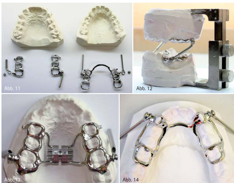
Abb. 11: Fertiges Herbst-Scharnier in der Aufsicht. – Abb. 12: Eingepasste Scharniere nach Konstruktionsbiss im Fixator. – Abb. 13: Modifikation: OK-Herbst mit Hyraxschraube. – Abb. 14: Modifikation: UK-Herbst nach Dres. Richter: Prämolaren nicht gefasst.

Mittlerweile gibt es eine Vielzahl an Modifikationen der klassischen Herbst-Apparatur. Dadurch haben sich neue Anwendungsgebiete im klinischen Bereich ergeben. Im Folgenden wollen wir kurz auf die Idee von Emil Herbst mit der oben beschriebenen Indikation eingehen und einen Einblick in die zahntechnische Herstellung im kieferorthopädischen Fachlabor gewähren (Abb. 1–14).