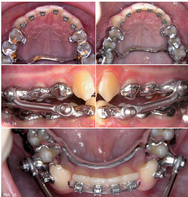
Abb. 22, 23: Ausformung der Oberkieferfront mit In-Ovation L-Brackets und Verankerung über die gegossene Herbst-Schiene. – Abb. 24, 25: Eingegliederte Herbst-Scharniere. – Abb. 26: Ausgeformte UK-Front.