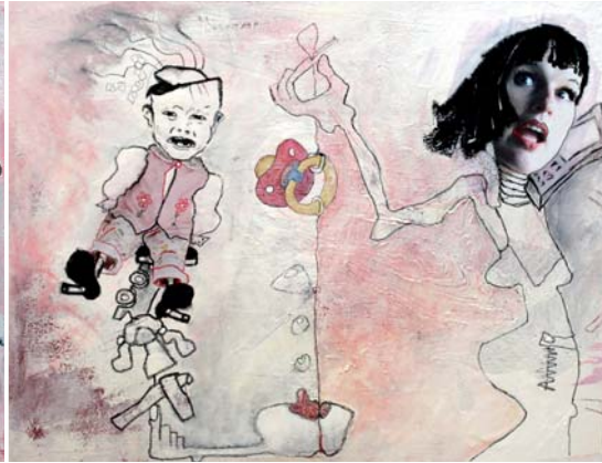
Wie machen wir jetzt den Mann für Töchter?