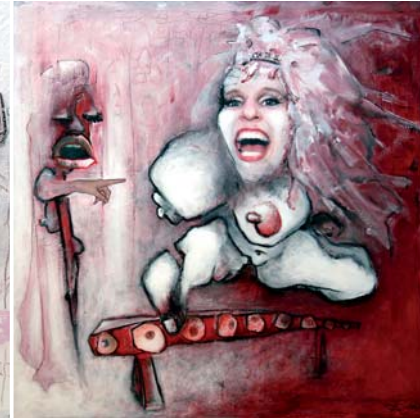
Sie hätte vorher schon fragen müssen