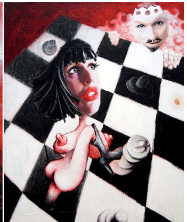
Heute ist die Krone fällig