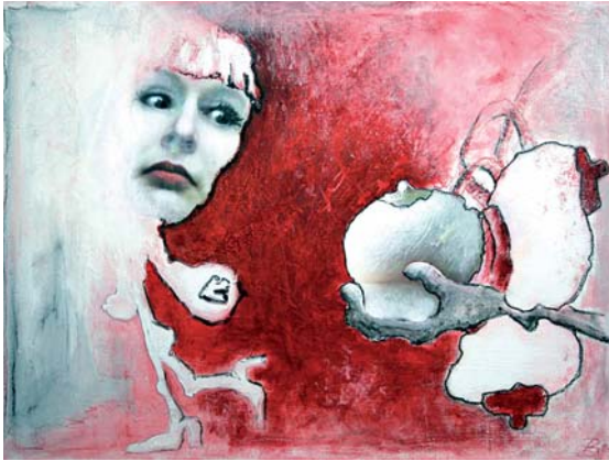
Das Geschenk der Mutter