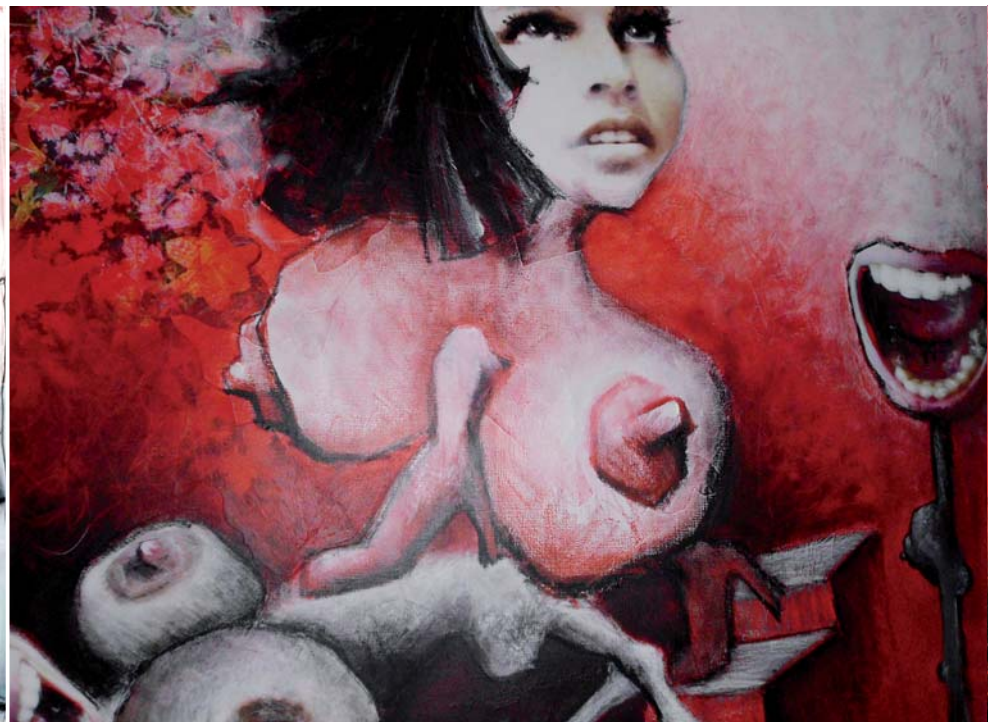
Frau Mentor und der Weg ins Glück