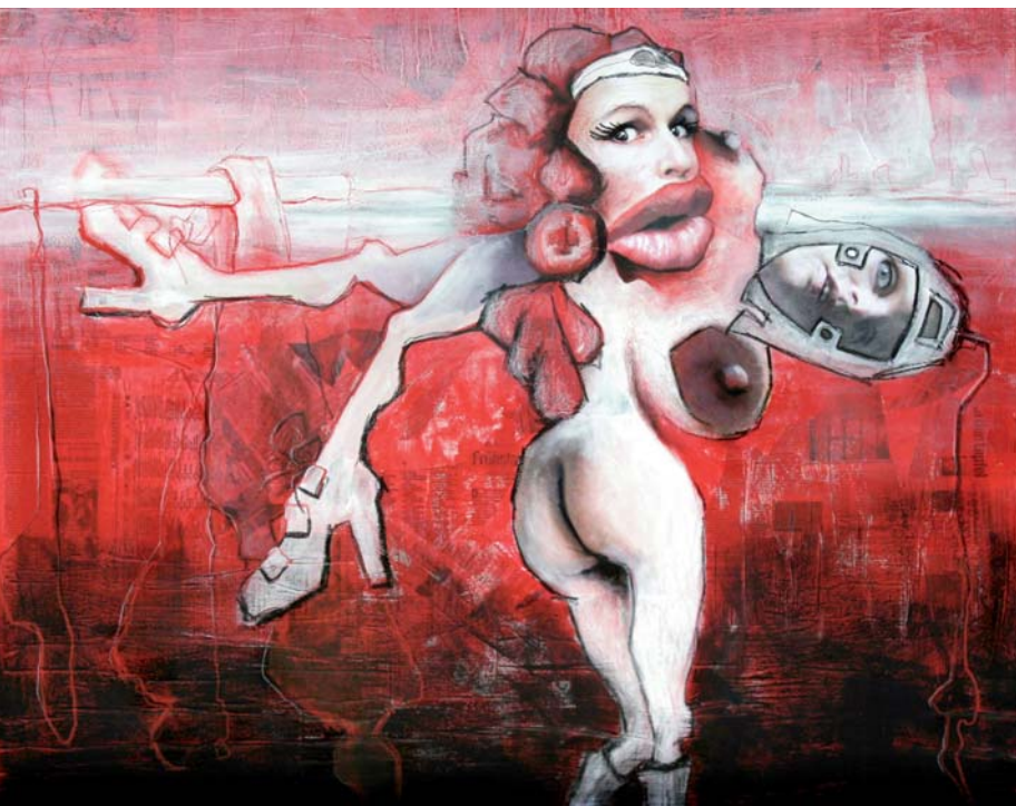
Frauenbild zu entsorgen