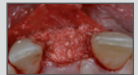
Frontzahn-Augmentation mit Double-Layer-Technik