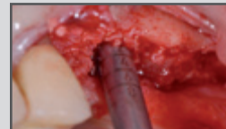
Sinuslift nach Summers