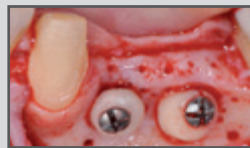
Laterale Augmentation im Seitenzahnbereich