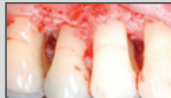
Parodontale Regeneration infraalveolärer Defekte