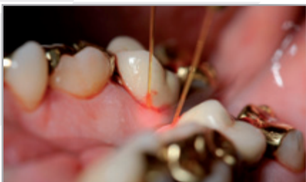
wie auch den therapeutischen Laser für die aPDT und bietet eine zusätzliche HF Einheit.