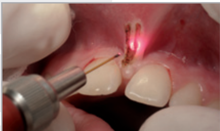
Das LaserHF kombiniert sowohl den Diodenlaser für chirurgische Eingriffe,