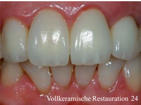
Vollkeramische Restauration 24