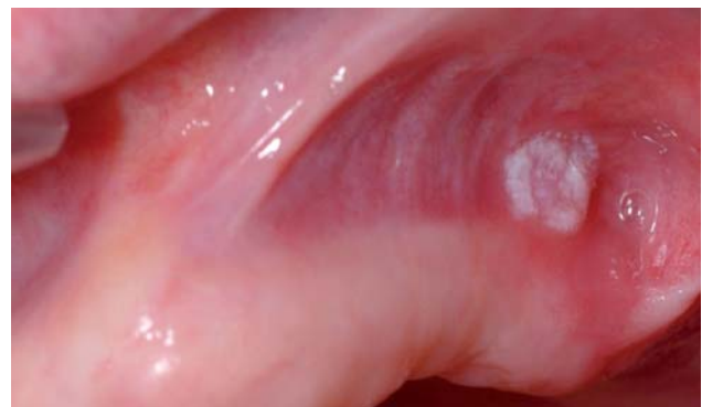
Abb. 1: Leukoplakia simplex im zahnlosen Oberkiefer.

Zu den Aufgaben des Zahnarztes und der Dentalhygienikerin gehören die Beseitigung und Vermeidung von auslösenden und verschlimmernden Faktoren (bakterielle Beläge, insuffizienter Zahnersatz) ebenso wie die