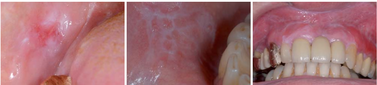
Abb. 5: Erythroplakie mit zentralem roten Ulkus und von weißlichen Randbereich umgeben. – Abb. 6: Lichen planus mit typischer Felderung/Wickhamsche Streifung. – Abb. 7: Lichen erosivus mit Wickhamscher Streifung, Schleimhautablösungen und deutlich roten und erosiven Anteilen.

Definition: Chronische, nichtinfektiöse Entzündung der Schleimhaut und/oder der Haut, wahrscheinlich autoimmun. Sie besteht Wochen, Monate bis Jahre, kann sich spontan wieder zurückbilden und ist die zweithäufigste