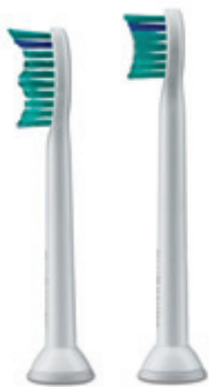
Zwei Bürstenkopfgrößen für eine komplette und gründliche Reinigung.

Motivieren Sie Ihre Patienten zu einer gesunden Zahnpflege – mit der FlexCare+. Die FlexCare+ gibt Ihren Patienten ein sauberes, erfrischendes Gefühl bei jedem Putzen. Und die Motivation, die sie brauchen, um außergewöhnliche Ergebnisse zu erzielen.