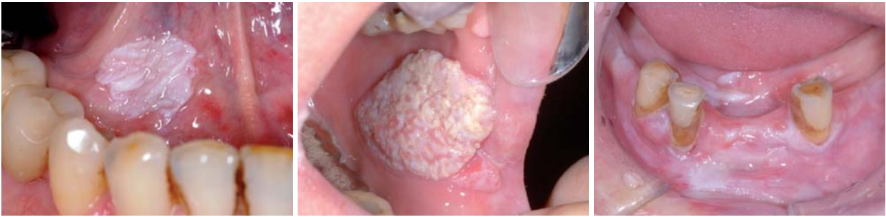
Abb. 2: Leukoplakia simplex mit homogener, weißlicher und scharf abgegrenzter Schleimhautveränderung. – Abb. 3: Leukoplakia verrucosa mit weißlicher, warzenartig erhabener Schleimhautveränderung. – Abb. 4: Erosive Leukoplakie mit inhomogener, weißlicher Veränderung und rötlichen, erosiven Anteilen.

cherweise zur Entstehung der Mundschleimhautveränderung geführt haben. Dazu gehört die Beseitigung möglicher scharfer Kanten an Zähnen oder Zahnersatz. Druckstellen sollten ausgeschliffen werden. In extremen Fällen empfiehlt sich dem Patient eine Prothesenkarenz von mindestens einer Woche zu verordnen. Rauchern sollte geraten werden das Rauchen aufzugeben oder zumindest stark zu reduzieren. Auf weitere Reizstoffe, wie Alkohol, starke Fruchtsäuren oder scharfes Essen, sollte für mindestens zwei Wochen verzichtet werden. Bei schlechter Mundhygiene muss der Patient durch Mundhygienemaßnahmen und Instruktionen zur besseren häuslichen Zahnpflege motiviert werden.