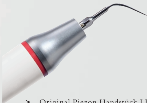
> Original Piezon Handstück LED mit EMS Swiss Instrument PS

Praktisch keine Schmerzen für den Patienten und maximale Schonung des oralen Epitheliums – grösster Patientenkomfort ist das überzeugende Plus der Original Methode Piezon, neuester Stand. Zudem punktet sie mit einzigartig glatten Zahnoberflächen. Alles zusammen ist das Ergebnis von linearen, parallel zum Zahn verlaufenden Schwingungen der Original EMS Swiss Instruments in harmonischer Abstimmung mit dem neuen Original Piezon Handstück LED.