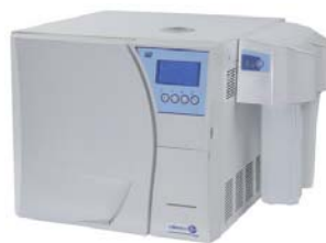
mit Mocopure 100