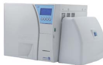
mit Mocopure 500