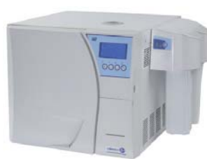
mit Mocopure 100