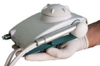
Jetpolisher Prophylaxe Gerät