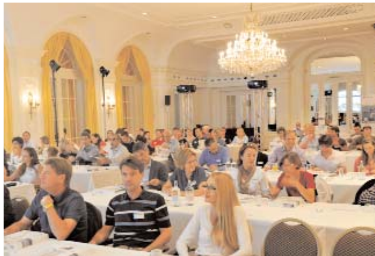
Mit 85 Kieferorthopäden war der zweitägige Incognito™-Zertifizierungskurs in Bern sehr gut besucht.