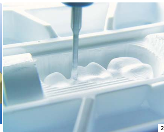
Abb. 1: Computergestützte Rekonstruktion: Scan-Daten des Antagonisten, der funktionellen Bewegung, der Lateralzähne und der Präparation fließen in die Kauflächengestaltung ein. – Abb. 2: Zirkoniumdioxidkeramik für Kronen und Brücken kann nur mit NC-gesteuerten Fräsautomaten bearbeitet werden.

Die Qualität von CAD/CAM-Restaurationen wurde kritisch gesehen und es gab nur wenige „Pioniere“, die sich mit diesem Thema auch wissenschaftlich auseinandersetzten. Inzwischen hat sich das Blatt gewendet. Aus der zögerlichen und teilweise auch abwartenden Haltung gegenüber dem computergefertigten Zahnersatz ist jetzt ein etabliertes Verfahren geworden (Abb. 1).