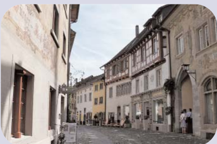
Impressionen des Treffens 2011 des Club 50 in der Region Schaffhausen und Stein am Rhein.