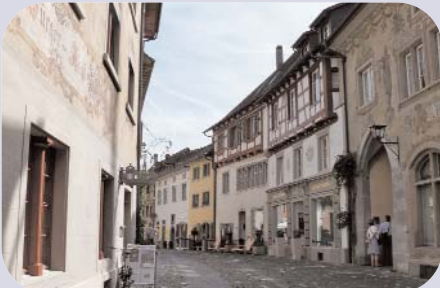
Impressionen des Treffens 2011 des Club 50 in der Region Schaffhausen und Stein am Rhein.