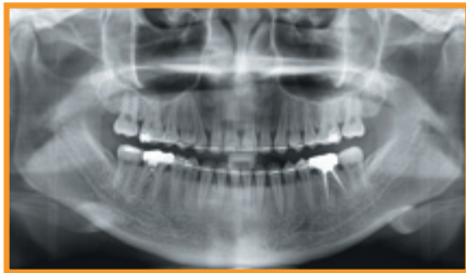
>> Top OPG Qualität - unlimited

Noch nie war der Einstieg in 3D Röntgen so attraktiv und flexibel!