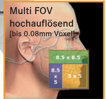
>> mit Freischaltoption für FOV 12 x 8.5 cm

Multi FOV hochauflösend [bis 0.08mm Voxel]