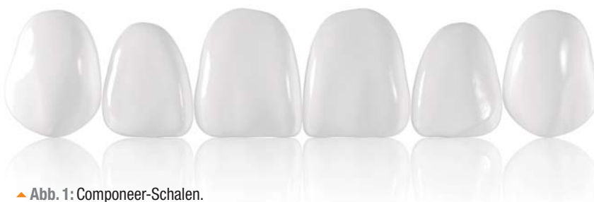
▲ Abb. 1: Compeer-Schalen.

Dieses Vorgehen wird für die gesamte Front wiederholt. Die Schalen werden nacheinander platziert, bis alle Schalen gleichmäßig eingesetzt sind (Abb. 8). Ihr Aussehen entspricht allerdings noch nicht ganz dem gewünschten jugendlichen Charakter. Deshalb wird nun, wie geplant, die Oberfläche stärker reduziert und extrem jugendlich charakterisiert. Trotz der Nachbearbeitung glänzen die