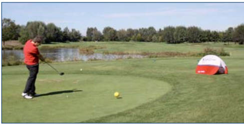
▲ Bestes Spätsommerwetter in St. Leon-Rot.