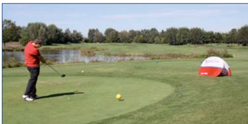
▲ Bestes Spätsommerwetter in St. Leon-Rot.