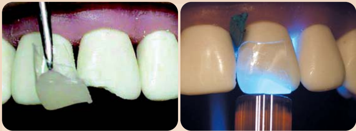
Abb. links: Anwendung einer CoForm. – Abb. rechts: Lichthärtung einer CoForm.

parente CoForm Matrix. Da die praktischen, vorgefertigten mesialen und distalen Ecken von CoForm nicht am Komposit haften, lassen sie sich nach Lichthärtung der Restauration sehr leicht und widerstandslos entfernen.