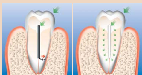
Abb. links: Metallstift – Wurzelfraktur! – Abb. rechts: Rebilda Post – dentinähnliche Elastizität!

Anton-Flettner-Straße 1–3 27472 Cuxhaven Tel.: 04721 719-0 Fax: 04721 719-169 www.voco.de