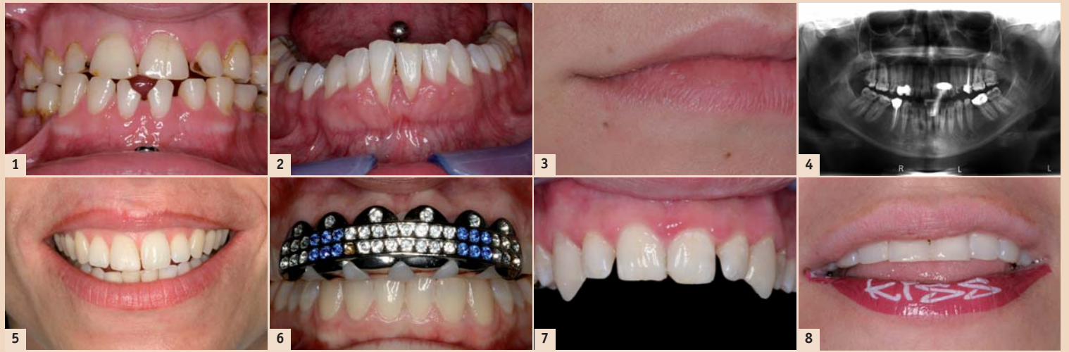
Abb. 1: Deutliche Abfraktionen mesial 31 und 41 infolge Trauma durch das Zungenpiercing. – Abb. 2: Zungen- und Lippenpiercingträger. Die Rezessionen labial 41 und 31 sind auf die Traumatisierung durch das Lippenpiercing zurückzuführen. – Abb. 3: Narbenbildung unterhalb der Unterlippe rechts. An dieser Stelle hat die Patientin während mehrerer Jahren ein Piercing getragen. – Abb. 4: Das Zungenpiercing wurde bei der Anfertigung des Röntgenbildes nicht entfernt und zeichnet sich als helle Struktur im Bereich der Frontzähne ab. – Abb. 5: Die Patientin ließ sich nach einem Unfall und daraus resultierender Narbenbildung im Oberlippenbereich die Konturen des Lippenrots mit Permanent-Make-up-Farben nachziehen. Die Farbe wurde dabei mehrmals in die obere Hautschicht eingebracht. Das Bild zeigt ein Zwischenschritt dieser kosmetischen Behandlung. – Abb. 6: Oberkiefer-Grill, der aus dem Internet bestellt wurde. Der weiße Kunststoff, der auf der Zahnreihe aufliegt und das Metallgitter befestigt, wird in heißem Wasser weich gemacht und dann auf die Zahnreihe gepresst. – Abb. 7: Eckzahnverlängerung im Oberkiefer mit Komposit. Der Patient ließ sich die Aufbauten bereits ein paar Tage später wieder entfernen, da der Arbeitgeber (und die Lebenspartnerin) diese Mundzierde nicht akzeptierten. – Abb. 8: Unterlippe mit Lippen-Sticker (Hersteller: Violent Lips) mit Aufschrift. Die Oberlippe wurde noch nicht „geschminkt“.

Der Patient sollte unbedingt auf mögliche Risiken und Komplikationen bei oralen Piercings hingewiesen werden. Er sollte ebenfalls über Mundpflege