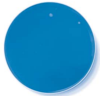
Nach 40 Sekunden Behandlung mit OzoneDTA.

Es ist uns schon ein wenig unangenehm, dass ein Anruf bei uns etwa 15 mal länger dauert, als das oben gezeigte Ergebnis zu erreichen. Aber wir machen es wieder gut: