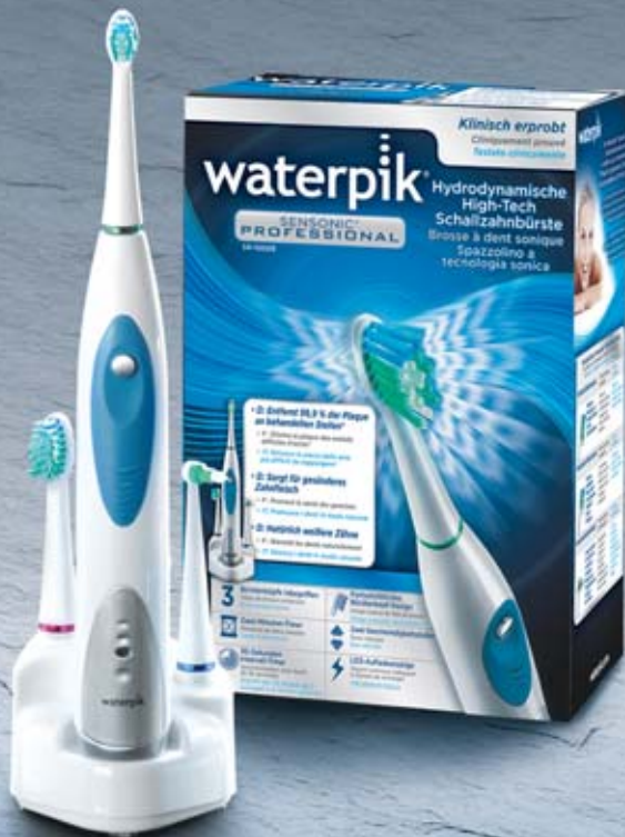
Waterpik® hydrodynamische Schallzahnbürste SENSONIC Professional SR-1000E