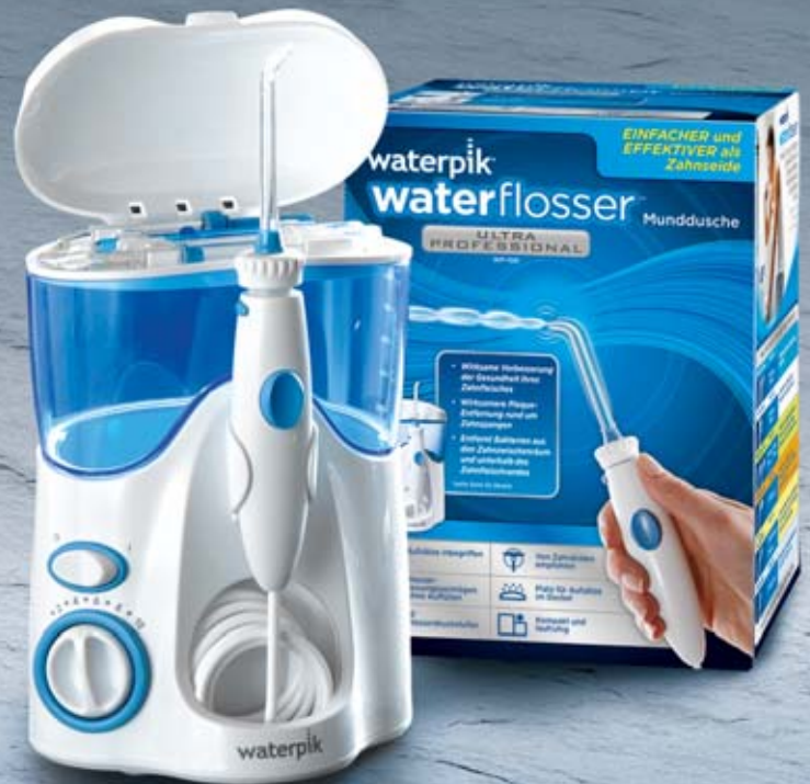
Waterpik® Munddusche Ultra Professional WP-100E4