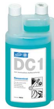
Abb. 5: DC1 ist ein kombiniertes Reinigungs- und Desinfektionsmittel, das eine viruzide, bakterizide und fungizide Wirkung in 1%iger Konzentration nach 60 Minuten zeigt.

rapie sind circa sieben bis 14 Tage. Die sich mit folgenden Schlagworten zusammenfassen lässt: Kontrolle und Dokumentation API, SBI, Mundhygieneberatung und Motivation, Nachreinigung, Politur und Fluoridierung, ggf. entsprechend der Werte-Speicheldiagnostik z.B. www.lcl-biokey.de , erneute Instruktion. Terminabstand sieben bis 14 Tage. Erst dann folgt der nächste Abgleich, je nach Mitarbeit und entsprechender Werte wird auch der PA-Plan erstellt, evtl. Modellerstellung, Besprechung weiterer Behandlungsablauf. Nach der Genehmigung beim GKV-Patienten erfolgt die Parodontitis-therapie.