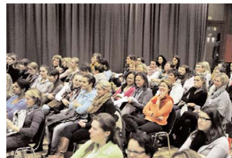
Der Vortrag stiess auf grosses Interesse.