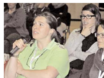
Die Möglichkeit, Fragen zu stellen, wurde rege genutzt.

wertvolle Tipps für den Praxisalltag in seine Ausführungen mit einfließen.