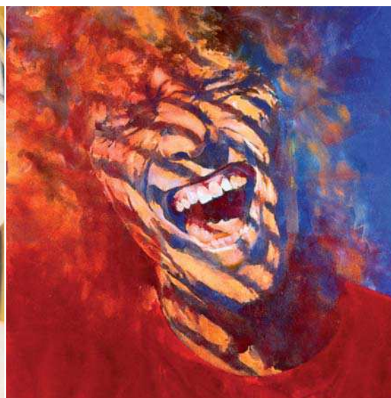
Wild at Heart