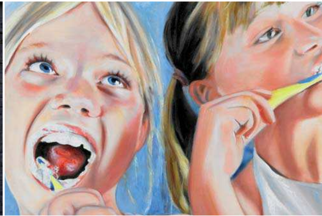
Kinder beim Zähneputzen