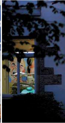
Praxis bei Nacht