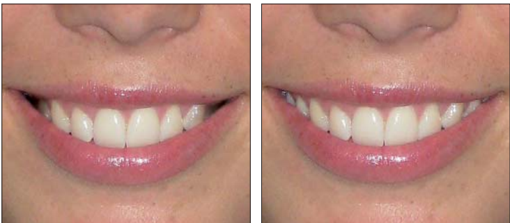
SMILE Rx von FORESTADENT reduziert Bukkalkorridore signifikant und realisiert ein breites, attraktives Lächeln.

alle gängigen Bogenformen – entsprechend des jeweils vorliegenden natürlichen Zahnbogens – eingesetzt werden. Eine neue Bogenschablone erleichtert hierbei die Auswahl. Bei SMILE Rx kommen gleich zwei bewährte SL-Brackets von FORESTADENT zur Anwendung – die aktiven Bio-Quick ® - und die passiven Bio-Passive ® -Brackets. Beide lassen sich optimal miteinander