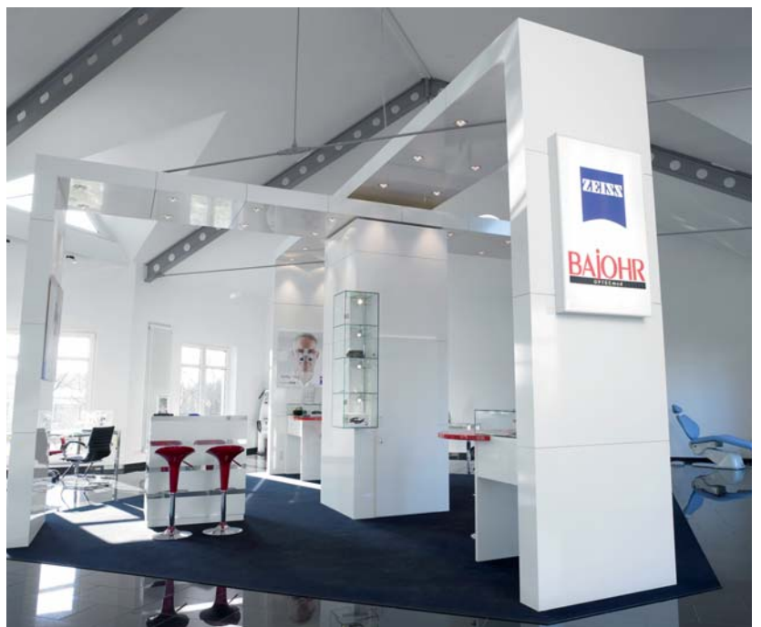
Großes Anpassstudio und Showroom, Zeiss Lupenbrillen und Mikroskope, Bajohr OPTECmed.

Die meisten auf dem Markt befindlichen TTL-Systeme (through the lens) sind aufgrund minderwertiger Optiken und nicht ausreichender Vorneigung