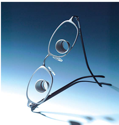
Fernrohrbrille G2 (2-fache Vergrößerung).