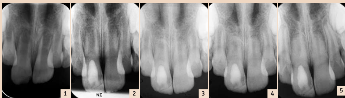
Abb. 1: Rx am Unfalltag. – Abb. 2: Rx nach Sterilisation und PC-Einlage und SAT-Versorgung. – Abb. 3: Rx drei Monate nach Einlage. – Abb. 4: Rx zehn Monate später zeigt Wurzelreifung. – Abb. 5: Rx 14 Monate nach der Behandlung zeigt eine deutliche Apexbildung und Wurzelwandwachstum.

wie auch immer gearbeteten, apikalen Barriere der offenen Wurzel. Eine weitere Behandlungsmöglichkeit ist das Setzen von MTA-Plugs (Stopfen) direkt an den offenen Wurzelspitzen. Diese Plugs dichten die Kanäle zum apikalen Weichgewebe hin ab und können gleichzeitig