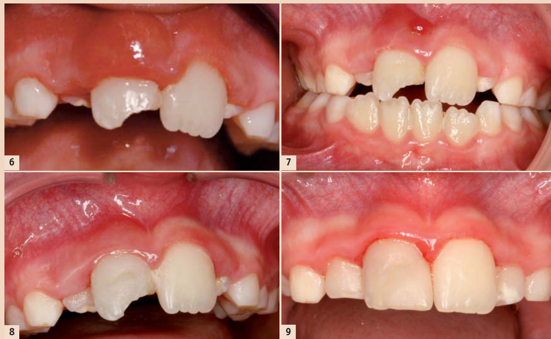
Abb. 6: Situation eine Woche nach dem Unfall. – Abb. 7: Situation zwei Wochen nach der Sterilisation, vor der SAT-Versorgung. – Abb. 8: Situation vor SAT-Versorgung (die Fistel ist verschwunden). – Abb. 9: Situation 16 Monate nach dem Unfall.

Die nächste Kontrolle fand drei Wochen nach der ersten Einlage statt.