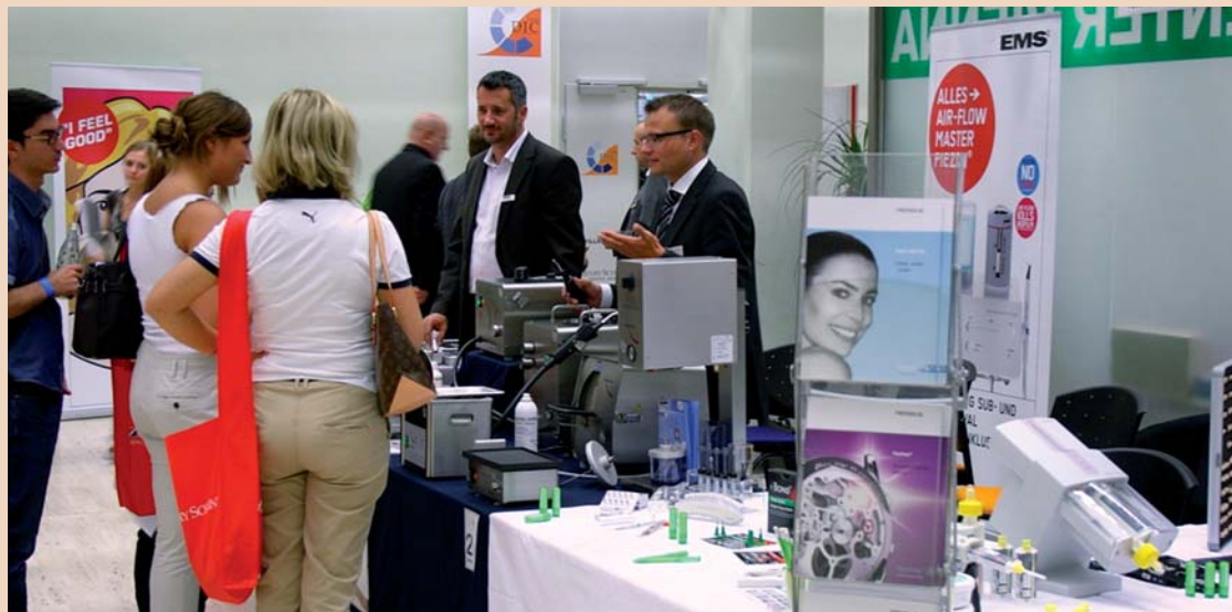
Kunden beim diesjährigen Herbstfest von Henry Schein Dental Austria in Wien.

Das Herbstfest gehört zu den regional größten Kundenveranstaltungen im Hause Henry Schein in Österreich. Über 200 Besucher aus ganz Österreich folgten der Einladung des Marktführers.