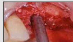
Sinuslift nach Summers