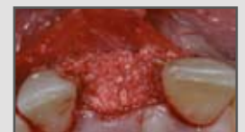
Frontzahn-Augmentation mit Double-Layer-Technik