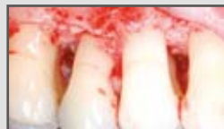
Parodontale Regeneration infraalveolärer Defekte