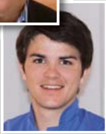
Dr. Christian Helf

„Regenerative Verfahren stehen heute im Mittelpunkt der Parodontal- und Implantatchirurgie. Implantate können ohne ein geeignetes Knochenlager nicht erfolgreich und suffizient inseriert werden.“