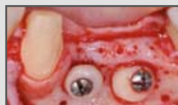
Laterale Augmentation im Seitenzahnbereich