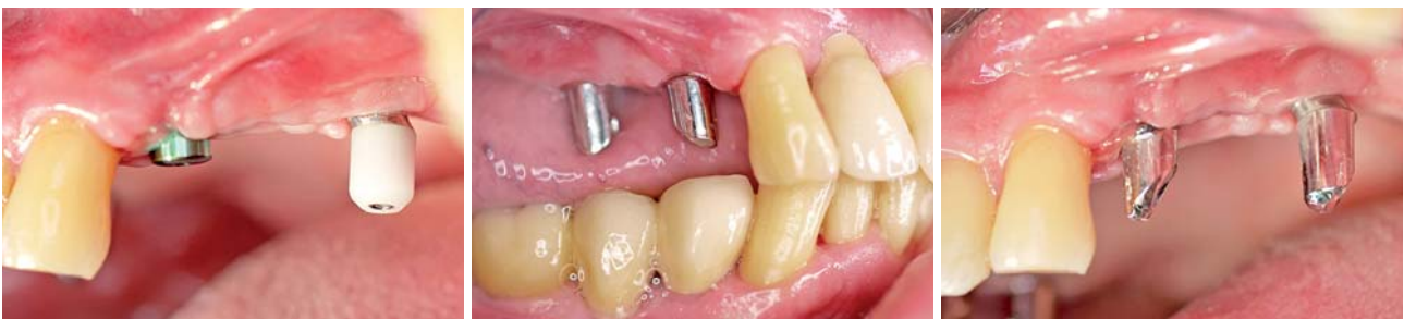
Abb. 3: Implantate, versorgt mit den Gingivaformern (hier Regio 24 = axial inseriertes Implantat und Regio 26 = ein mit 35° Neigung inseriertes Implantat mit DAAS Gingivaformer). – Abb. 4: Individuelle Abutments auf den Implantaten Regio 14 und 16 (beide axial inseriert). – Abb. 5: Individuelle Abutments auf den Implantaten Regio 24 (axial inseriert) und 26 (geneigt).

Der Patient (51 Jahre alt, Nichtraucher), hat sich wegen der fortgeschrittenen parodontalen Destruktion im Oberkiefer bei einem Kollegen vorgestellt, ein Jahr vor Beginn der in diesem Bericht beschriebenen Behandlung (Abb. 1). Die Zähne 18–14, 12 und 24 (Wurzelrest), 25–27 wurden extrahiert. Die Extraktionsalveolen wurden mittels dPTFE-Membranen (Cytoplast, Osteogenics Biomedical, Lubbock, TX, USA) ohne zusätzliche Verwendung von Knochenersatzmaterialien abgedeckt (Hoffmann et al. 2008, Zafiropoulos et al. 2010). Der Mukoperiostlappen wurde repositioniert und im Bereich der Papillen mit Einzelnähten fixiert (Cytoplast Nahtmaterial, Osteogenics Biomedical, Lubbock, TX, USA). Die Membranen blieben zum Teil exponiert und wurden nach vier Wochen entfernt. Anschließend wurden die zahnlosen Bereiche mit einer Modellgussprothese versorgt.