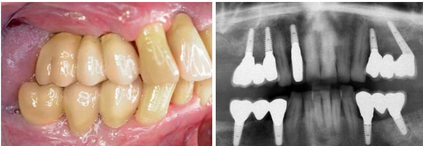
Abb. 8: Die Implantate werden mit definitiven Metall-Keramik-Brücken versorgt und belastet. – Abb. 9: Orthopantomograf nach Eingliederung der Restaurationen.