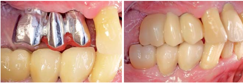
Abb. 6: Anprobe der Metallgerüste in Regio 14–16. – Abb. 7: Die Implantate werden mit provisorischen Brücken aus PMMA versorgt und belastet.