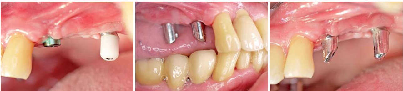
Abb. 3: Implantate, versorgt mit den Gingivaformern (hier Regio 24 = axial inseriertes Implantat und Regio 26 = ein mit 35° Neigung inseriertes Implantat mit DAAS Gingivaformer). – Abb. 4: Individuelle Abutments auf den Implantaten Regio 14 und 16 (beide axial inseriert). – Abb. 5: Individuelle Abutments auf den Implantaten Regio 24 (axial inseriert) und 26 (geneigt).