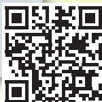
Erste Ausgabe Implantologie Journal 1997