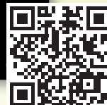
Erste Ausgabe implants 2005