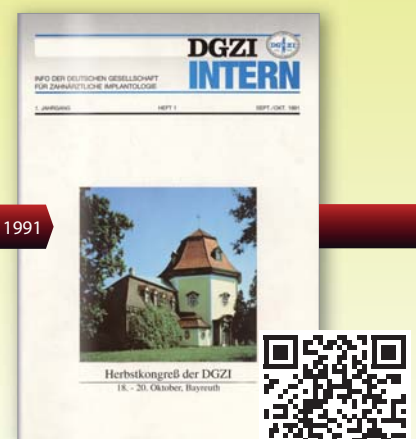
Erste Ausgabe DGZI intern 1991