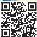
Erste Ausgabe international magazine of oral implantology 2000