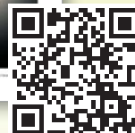
Implantologie Journal 1998