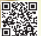
Implantologie Journal 2001