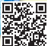
Erste Ausgabe international magazine of oral implantology 2000