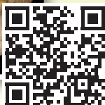
Implantologie Journal 2002