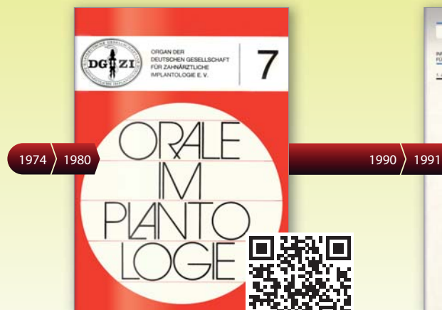
Erste Ausgabe Orale Implantologie 1980

Lesen Sie die historischen Ausgaben per QR-Code als E-Paper.