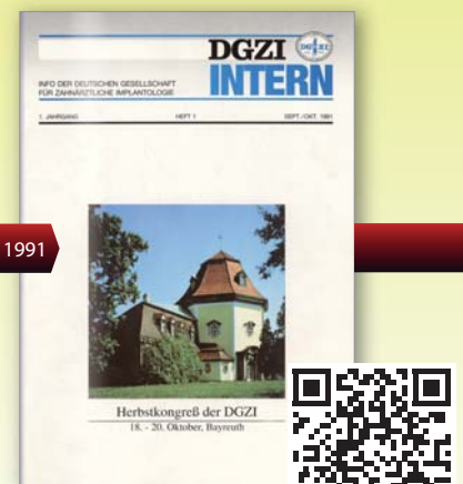
Erste Ausgabe DGZI intern 1991