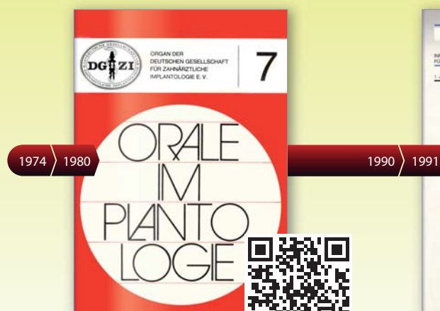
Erste Ausgabe Orale Implantologie 1980

Lesen Sie die historischen Ausgaben per QR-Code als E-Paper.