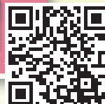
Implantologie Journal 2011