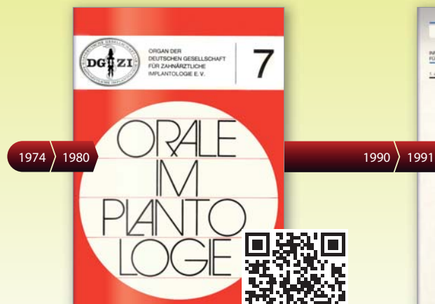
Erste Ausgabe Orale Implantologie 1980

Lesen Sie die historischen Ausgaben per QR-Code als E-Paper.