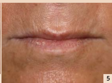
Abb. 4: Schmales Lippenprofil im Mundwinkelbereich und Ausbildung von sogenannten Marionettenfalten. – Abb. 5: Sehr zufriedenstellendes Ergebnis nach zweifacher Augmentation mit Hyaluronsäure.