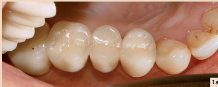
Abb. 1a: Deutlich zu erkennender knöcherner Defekt in Regio 14–16 (gespiegelt). – Abb. 1b: Zu palpierender Defekt von Extraoral. – Abb. 2: Erkennbarer Weichteildefekt von extraoral bei s/w-Darstellung. – Abb. 3: Erfolgreich augmentierter Bereich mit Hyaluronsäure.

Der kritische Zahnarzt ist sich durchaus bewusst, dass nicht alle Patienten ausnahmslos durch eine zahnmedizinische Therapie zufriedenzustellen sind und dass die Erwartungshaltung ein Konglomerat aus dem individuellen psychologischen Status quo, der Compliance und nicht zuletzt der finanziellen Möglichkeiten des Patienten ist. Hier ist die besonders feinfühligste Kommunikation vor, während und oft auch nach der Behandlung des Zahnarztes gefragt. Die Bereitschaft des Patienten, das Behandlungsergebnis als nicht befriedigend zu empfinden und einen Anwalt zurate zu ziehen, verhält sich reziprok zu dem oben aufgeführten Konglomerat. Der gewissenhafte und informierte (Zahn-) Arzt erkennt psychologisch auffällige