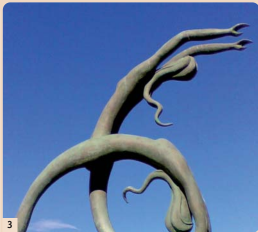
Das weibliche Schlankheitsideal künstlerisch dargestellt. (Skulptur: Hafenpromenade in Heraklion, Kreta.)

sind die meisten Bulimiepatientinnen gut ausgebildete und pflichtbewusste Frauen. Sie neigen dazu, sich in Beziehungen übermässig anzupassen und unterzuordnen. Bulimiekranken hegen nicht nur bezüglich Körpergewicht und Aussehen sehr hohe Erwartungen an sich selbst, sondern auch bezüglich ihrer Leistungen in anderen Lebensbereichen. Hintergrund für die erwähnten Störungen bildet meist eine Kindheitskonstellation, wie sie von der Psychoanalytikerin Alice Miller treffend als „Drama des begabten Kindes“ beschrieben worden war: 5 Sie fühlten sich als Kinder nicht richtig geliebt und kämpften dauernd um die Anerkennung der Eltern. Vor allem hofften sie, aufgrund von guten Leistungen und der Erfüllung aller Erwartungen der Eltern von diesen Zuwendung zu erhalten, was ihnen aber nie richtig gelingen konnte. Oft liegen schwere Selbstwert- und Beziehungsstörungen (z.B. Borderlinestörung) als Folge psychischer Traumatisierungen (Missbrauch) vor.