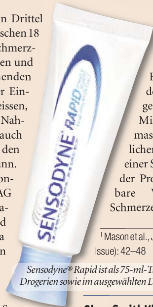
Sensodyne® Rapid ist als 75-ml-Tube in Apotheken und Drogerien sowie im ausgewählten Detailhandel erhältlich.

Heute leidet etwa ein Drittel der Erwachsenen zwischen 18 und 64 Jahren an schmerzempfindlichen Zähnen und kennt den stechenden Schmerz, der bei der Einnahme von kalten, heissen, süssen und sauren Nahrungsmitteln, aber auch durch Berührung an den Zähnen entstehen kann. GlaxoSmithKline Consumer Healthcare AG hat sich dieser Thematik angenommen und mit der Zahnpasta Sensodyne® Rapid ein Produkt entwickelt, das die Schmerzempfindlichkeit von Zähnen in nur 60 Sekunden lindert und bei zweimal täglichem Zähneputzen einen lang anhaltenden Schutz bietet. Die Strontiumacetat-Formel der Zahnpasta bildet eine tiefe und säurestabile Okklusionsbarriere, die die offenen