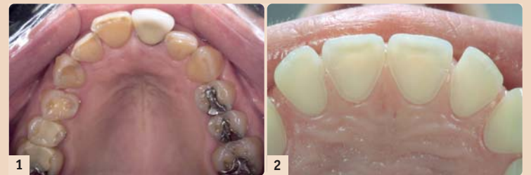
Abb. 1: Oberkiefer eines 29-jährigen Mannes (!) mit einer jahrelangen Essstörung. – Abb. 2: Das Bild zeigt eine ca. 25-jährige Frau mit massiven Substanzverlusten an den Palatinalflächen am Oberkiefer, sodass bereits die Pulpa rosa durchscheint.

Die Bulimie wurde erst 1980 in der amerikanischen psychiatrischen Nomenklatur (DSM-III) als eigenständige Krankheit beschrieben und hat später auch Eingang in die ICD-10 gefunden ( Tabelle 1 ). Seither ist eine rapide Zu-