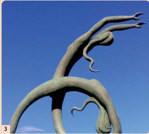
Das weibliche Schlankheitsideal künstlerisch dargestellt. (Skulptur: Hafenpromenade in Heraklion, Kreta.)

sind die meisten Bulimiepatientinnen gut ausgebildete und pflichtbewusste Frauen. Sie neigen dazu, sich in Beziehungen übermässig anzupassen und unterzuordnen. Bulimiekranken hegen nicht nur bezüglich Körpergewicht und Aussehen sehr hohe Erwartungen an sich selbst, sondern auch bezüglich ihrer Leistungen in anderen Lebensbereichen. Hintergrund für die erwähnten Störungen bildet meist eine Kindheitskonstellation, wie sie von der Psychoanalytikerin Alice Miller treffend als „Drama des begabten Kindes“ beschrieben worden war: 5 Sie fühlten sich als Kinder nicht richtig geliebt und kämpften dauernd um die Anerkennung der Eltern. Vor allem hofften sie, aufgrund von guten Leistungen und der Erfüllung aller Erwartungen der Eltern von diesen Zuwendung zu erhalten, was ihnen aber nie richtig gelingen konnte. Oft liegen schwere Selbstwert- und Beziehungsstörungen (z.B. Borderlinestörung) als Folge psychischer Traumatisierungen (Missbrauch) vor.