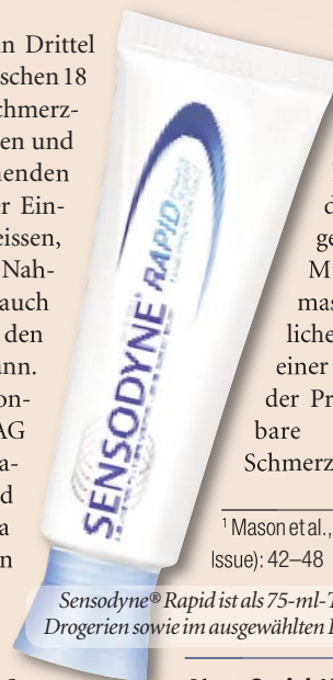
Sensodyne® Rapid ist als 75-ml-Tube in Apotheken und Drogerien sowie im ausgewählten Detailhandel erhältlich.

Heute leidet etwa ein Drittel der Erwachsenen zwischen 18 und 64 Jahren an schmerzempfindlichen Zähnen und kennt den stechenden Schmerz, der bei der Einnahme von kalten, heissen, süssen und sauren Nahrungsmitteln, aber auch durch Berührung an den Zähnen entstehen kann. GlaxoSmithKline Consumer Healthcare AG hat sich dieser Thematik angenommen und mit der Zahnpasta Sensodyne® Rapid ein Produkt entwickelt, das die Schmerzempfindlichkeit von Zähnen in nur 60 Sekunden lindert und bei zweimal täglichem Zähneputzen einen lang anhaltenden Schutz bietet. Die Strontiumacetat-Formel der Zahnpasta bildet eine tiefe und säurestabile Okklusionsbarriere, die die offenen