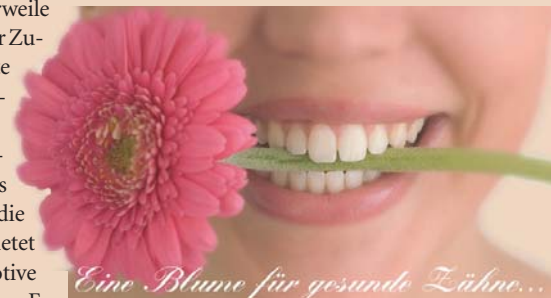
Eine Blume für gesunde Zähne...

Das Recallsystem hat sich mittlerweile in vielen Praxen bewährt. Mit der Zusendung einer Erinnerungskarte für Kontroll- oder Vorsorgeuntersuchungen erhöht der Zahnarzt die Aufmerksamkeit bei seinen Patienten um ein Vielfaches und gleichzeitig verstärkt das die Patientenbindung. Mirus Mix bietet eine Vielzahl verschiedener Motive Recallkarten und Postkarten an. Es gibt lustige, tierische und klassische Motive. Auf der Rückseite kann man zwischen einem Standardtext und einer Blankorückseite wählen, somit besteht die Möglichkeit, die Karten mit einem ganz individuellen Text zu bedrucken. Die Nachfrage von Recallkarten steigt von Jahr zu Jahr. Recallkarten erweisen sich als ein erweiterter Praxisservice und die Vorsorge kommt nicht zu kurz. Im umfangreichen Sortiment des Anbieters befinden sich natürlich auch die beliebten Kinderzugabeartikel, schöne Demo-