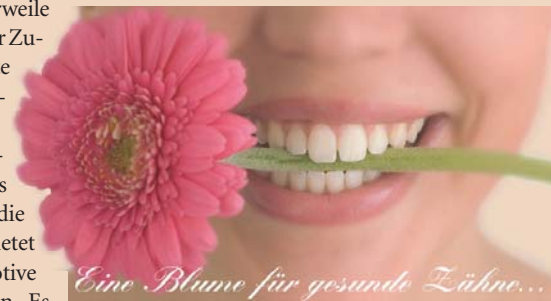
Eine Blume für gesunde Zähne...

Das Recallsystem hat sich mittlerweile in vielen Praxen bewährt. Mit der Zusendung einer Erinnerungskarte für Kontroll- oder Vorsorgeuntersuchungen erhöht der Zahnarzt die Aufmerksamkeit bei seinen Patienten um ein Vielfaches und gleichzeitig verstärkt das die Patientenbindung. Mirus Mix bietet eine Vielzahl verschiedener Motive Recallkarten und Postkarten an. Es gibt lustige, tierische und klassische Motive. Auf der Rückseite kann man zwischen einem Standardtext und einer Blankorückseite wählen, somit besteht die Möglichkeit, die Karten mit einem ganz individuellen Text zu bedrucken. Die Nachfrage von Recallkarten steigt von Jahr zu Jahr. Recallkarten erweisen sich als ein erweiterter Praxisservice und die Vorsorge kommt nicht zu kurz. Im umfangreichen Sortiment des Anbieters befinden sich natürlich auch die beliebten Kinderzugabeartikel, schöne Demo-