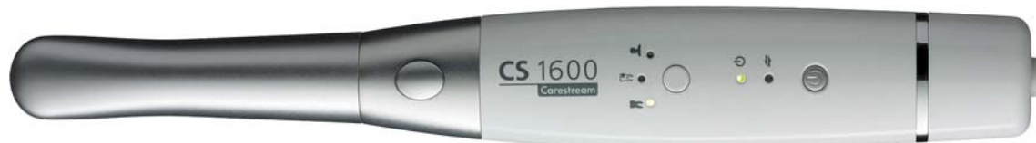
▲ Intraorale Kamera CS 1600

Alle Carestream Dental Produkte werden wie bisher nicht direkt, sondern über lizenzierte Handelspartner vertrieben. Darüber hinaus sind sechs Carestream Dental Produktberater bundesweit im Einsatz, um auf Basis persönlicher Praxisanalysen und Beratungen individuelle Lösungen zu erarbeiten, die über die gewünschten Handelspartner umgesetzt und abgewickelt werden. ◀◀