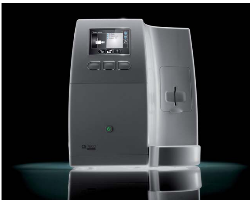
▲ Intraoral-Scanner CS 7600

Mit der vereinfachten Markenstruktur erhalten Zahnmediziner eine optimale