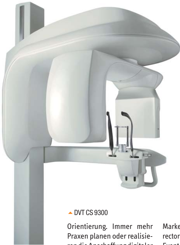
▲ DVT CS 9300

Orientierung. Immer mehr Praxen planen oder realisieren die Anschaffung digitaler