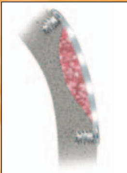
Schalentechnik mit 0,3 mm PDLLA-Folie

„Ich arbeite nun seit einem Jahr mit der Schalenteknik. In diesem Zeitraum wurde von mir kein Knochenblock mehr eingesetzt.“