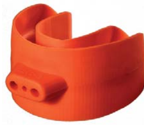
Abb. 10: Abdrucklöffel aus med. Silikon (FMT).

Das Einsatzfeld von kaltem Plasma in der Medizin ist groß und die evidenzbasierten Erkenntnisse hierüber stehen wohl erst am Anfang. Sie ist dagegen nicht so neu wie ihr Name in der Medizin. Unter dem Begriff Ozontherapie,