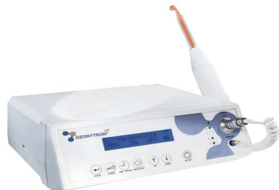
Abb. 7 und 8: Zwei Geräte zur Anwendung in der Plasmamedizin für die Dentalmedizin, Wundheilung, Dermatologie, HNO, Gynäkologie, Urologie und Orthopädie, Ozonwasser-Produktion sind hier vorgestellt (OZONYTRON XP/OZ).