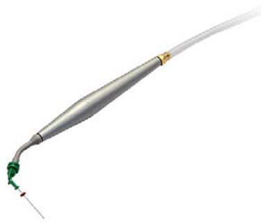
Abb. 6: Bei einzelnen Zahnfleischtaschen, Wurzelkanälen oder Fisteln eignet sich mehr die handliche KPX-Düse.

gang in organischen Zellen Verwendung findet, 1 \gamma = 1 \mu\text{ml} . Die Einheit g/h wird anstelle ppm für die Ozonanreicherung der Luft zur Eliminierung von Luftkeimen verwendet, hier ist die Umrechnung etwas komplizierter, da das Raumvolumen mit einbezogen werden muss. Bei der Umrechnung von ppm in \mu\text{ml} gilt der Faktor 0,002 bei der Umrechnung von ppm in \text{g}/\text{m}^3 ebenfalls gilt der Faktor 0,002 bzw. 2.000 bei \mu\text{g}/\text{m}^3 . Der jahresdurchschnittliche Ozonwert in der Luft liegt bei ca. 80 \mu\text{g}/\text{m}^3 . Der von der BRD angegebene Grenzwert für Ozonalarm, er lag bei 180 \mu\text{g}/\text{m}^3 , wurde zwischenzeitlich von der EU aufgehoben, ohne bislang einen neuen Grenzwert zu bestimmen.