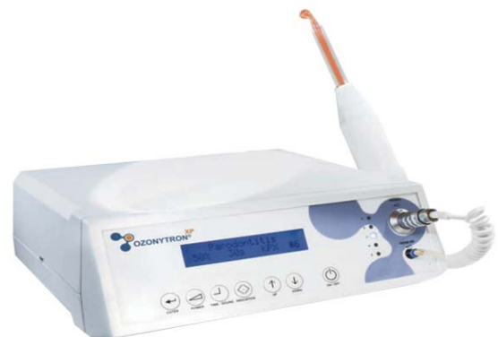
Abb. 7 und 8: Zwei Geräte zur Anwendung in der Plasmamedizin für die Dentalmedizin, Wundheilung, Dermatologie, HNO, Gynäkologie, Urologie und Orthopädie, Ozonwasser-Produktion sind hier vorgestellt (OZONYTRON XP/OZ).