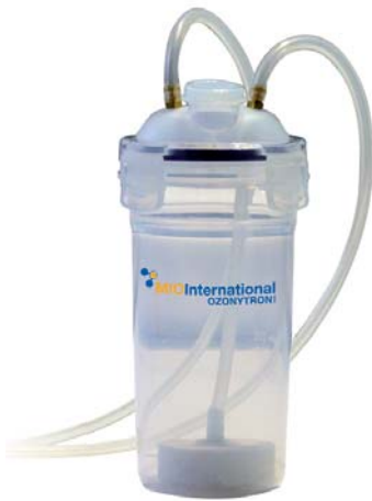
Abb. 9: Behälter für die Wasser-Ozonisierung mit dem Gerät XP (OZA).

tienten nicht durchführbar war, mit den vorliegenden apparativen Möglichkeiten sämtliche Parodontien mit Plasma zu durchfluten, hat die deutsche Firma MIO Int. OZONYTRON GmbH mit dem Gerätetyp OZONYTRON-XP/OZ, auch PLASMATRON-XPO genannt, eine ebenso effektive wie ergonomisch-wirtschaftliche Nevellierung auf den Markt gebracht. Unter Zuhilfenahme eines doppelseitigen Silikonabdrucklöffels ist es nun möglich, innerhalb weniger Minuten sämtliche Parodontien in einem einzigen Arbeitsgang unter Schutzatmosphäre zu desinfizieren (Full-Mouth-Disinfection). Im Plasma- bzw. Ozonerzeuger der Firma MIO werden die Sauerstoffmoleküle durch stille elektrische Entladung zu Sauerstoffatomen dissoziiert, wonach noch im Plasma der Entladungsfilamente die Ozonsynthese und Ozonanreicherung stattfinden. Die erreichbare Konzentration liegt bei wenigen 100 ppm bis zu mehreren 10.000 ppm unter Nutzung von Umweltluft. Bei der ebenfalls möglichen Nutzung von reinem Sauerstoff gehen die Konzentrationen bis zu 300.000 ppm.